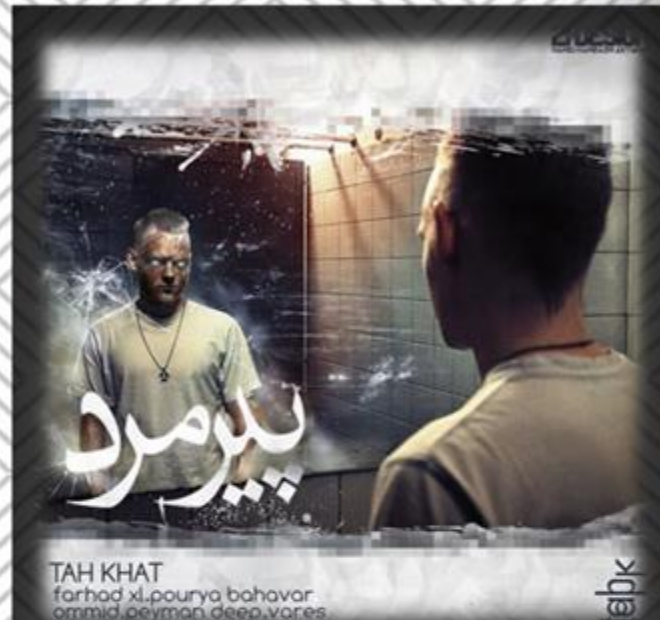
TAH KHAT farhad xl.pourya bahavar ormid, peyman, deep, vares