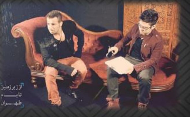
آرزو زیرزمین تا بام تهران

همانطور که اطلاع دارید زیرزمین تا بام تهران عنوان برنامه جدید اردشیر احمدی است که حول موزیک زیر زمینی هر ازچندگاهی از سایت های موزیک پخش میشود که قسمت اول آن با مصاحبه یاس منتشر شد. هم اکنون قسمت دوم این برنامه با مصاحبه امیر تتلو آماده شده است و به زودی از سایتهای معتبر موسیقی منتشر خواهد شد.