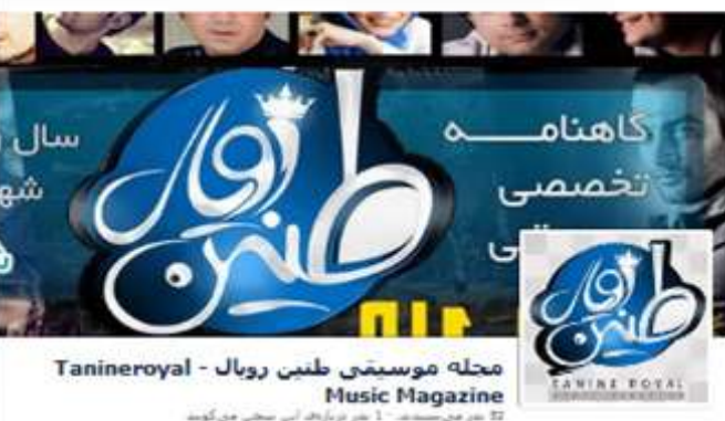
مجله موسیقی طنینی رویال - Tanineroyal Music Magazine 12 عدد در هر سال - 1 عدد در هر ماه - 1 عدد در هر فصل - 1 عدد در هر فصل

پروفایل فیسبوک مجله : FACEBOOK.COM/TRMAG