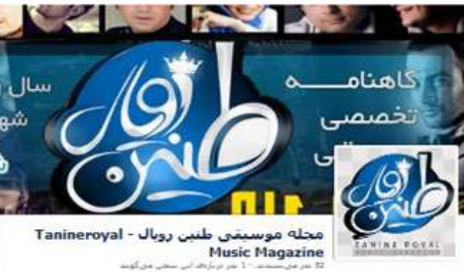
مجله موسیقی طینی رویال - Tanineroyal Music Magazine 12 عدد هر هفته - 1 عدد نورالهدیه این هفته می گوید

پروفایل فیسبوک مجله : FACEBOOK.COM/TRMAG